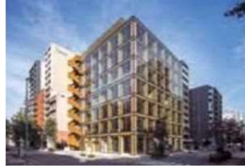
3 タマディック名古屋ビル