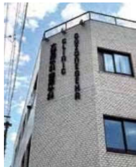
5 大曾根外科・整形外科のサイン