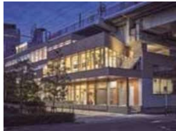
2 ささしま高架下オフィス