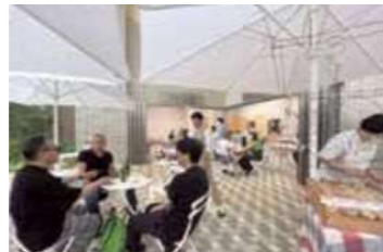
7 錦二丁目まちづくり協議会