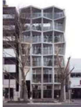
1 大須の一連のテナント・オフィス HASE-BLDG.