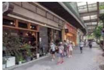
6 ニシヤマイバシオラボ