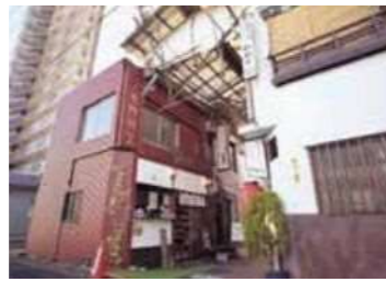
4 みんなで駄菓子屋(仮)