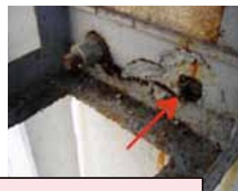
所定の場所にアンカーボルトがない状態