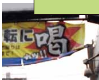
幕材を張る部材が破損した状態