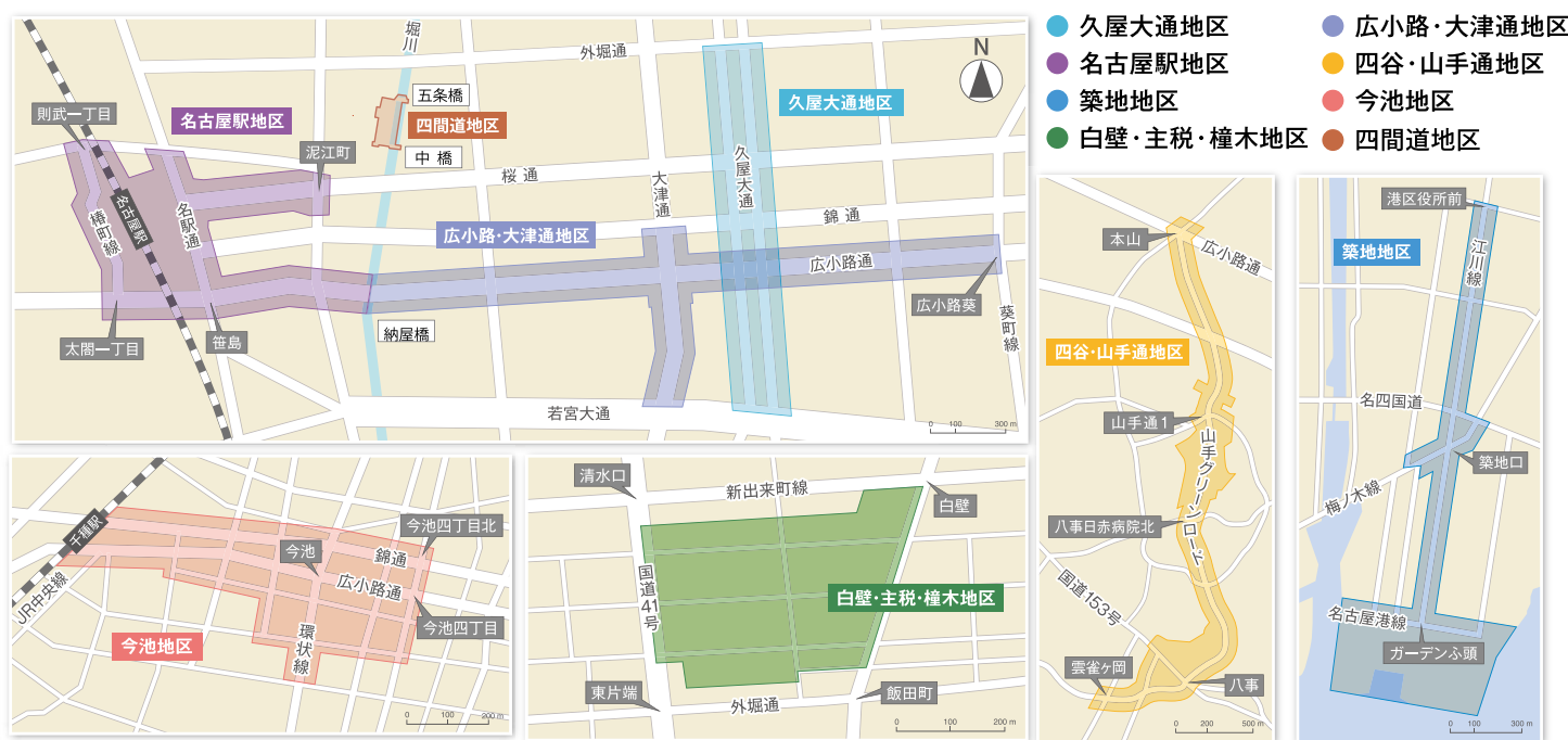
※スケールは目安です。

● 名古屋城眺望景観保全エリア／都市景観形成地区に関するお問い合わせ ウォークラブル・景観推進課（都市景観担当） 電話 052-972-2732 / メール a2732@jutakutoshi.city.nagoya.lg.jp