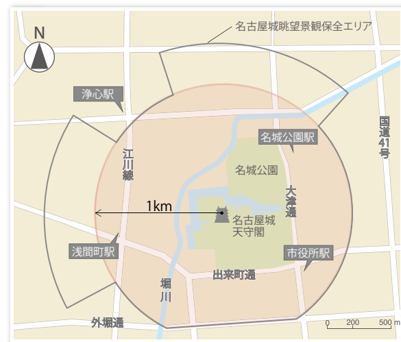
※スケールは目安です。