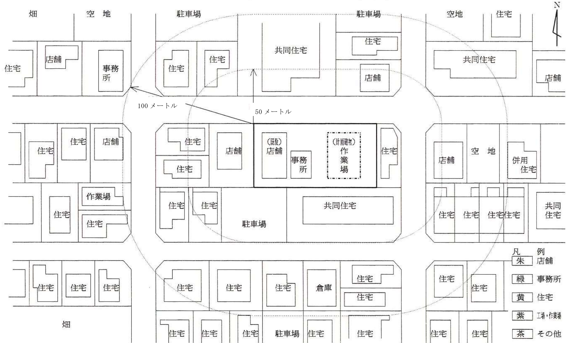
付近状況図（申請敷地境界より100mの範囲）