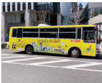
シャトルバス社会実験運行

協議会では、土地利用の方針と建築ルールを「ささしまライブ24地区整備方針」として取り決めているほか、良好な環境の維持・賑わいの創出・地域の価値向上などを目的に、地区内の定期清掃、広場の維持管理、イルミネーション・イベントの開催、シャトルバスの社会実験運行など、さまざまなエリアマネジメント活動を実施しています。