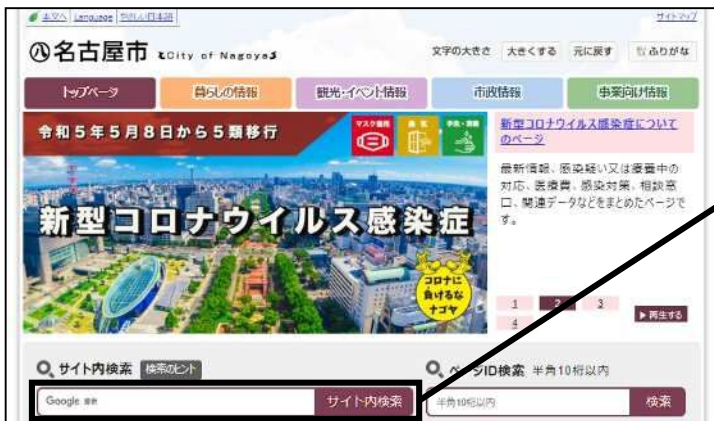
ホームページアドレス及びデザインは予告なく変更される場合があります。

名古屋市のトップページアドレス https://www.city.nagoya.jp/