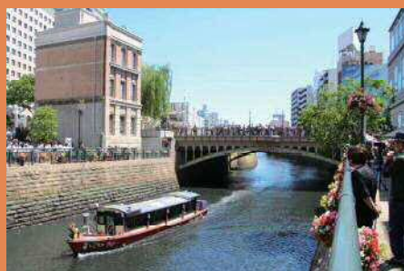
水辺活用を推進している堀川