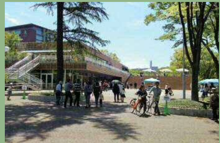
民間活力を活用した名城公園tonarino