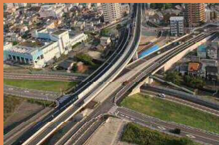
渋滞緩和と橋梁の耐震化を行った三階橋