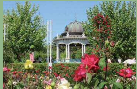
市民の憩いの場である鶴舞公園

○名古屋を代表する鶴舞公園、名城公園、久屋大通公園、東山公園、荒子川公園を始めとした公園は、民間の自由なアイデアや活力を取り入れながら、施設などの再整備や運営管理、魅力的なイベントの実施などに取り組んでいます。