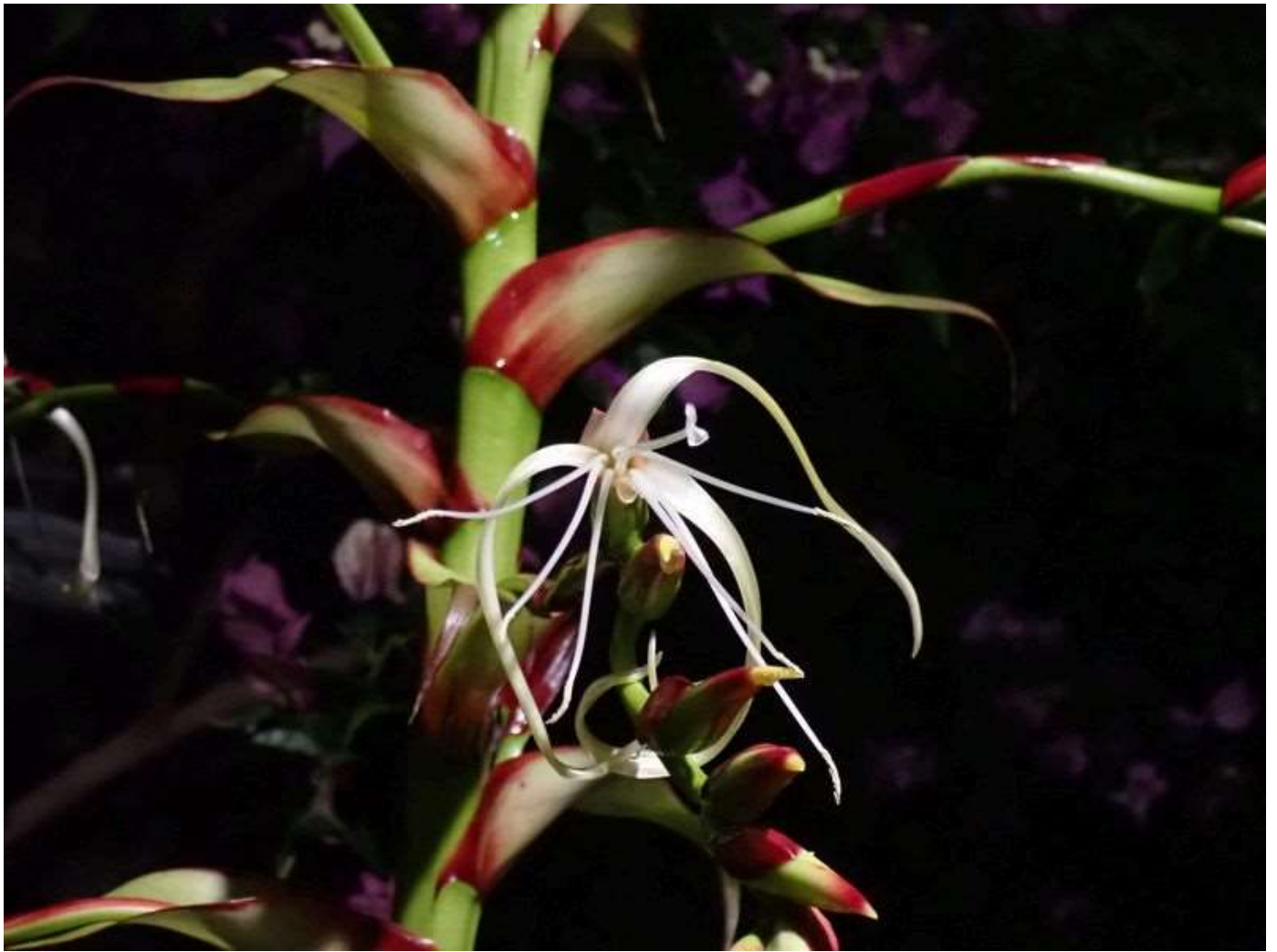
ミカドアナナス(花)