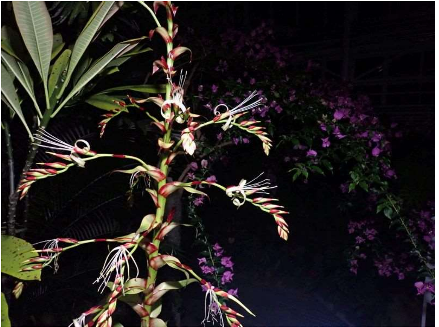
ミカドアナナス(花茎)