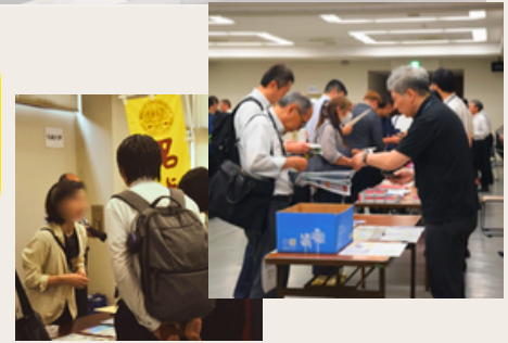
過去の交流会の様子