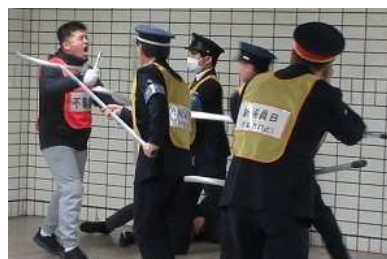
令和6年度の訓練の様子【今池駅】