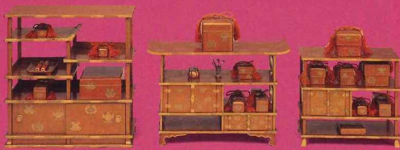
抱牡丹紋散蒔絵雛道具 三徳飾り 俊恭院福君(尾張家11代齊温継室)所用