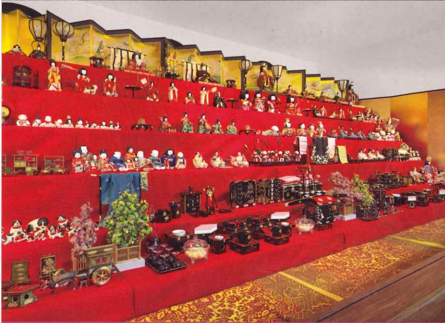
尾張徳川家三世代の雛段飾り

尾張徳川家で大切に守られてきた多種多様な雛飾りをご紹介します。本展は、今年で36回を数えます。本年も、江戸時代に尾張徳川家の姫君のためにあつらえられた雛人形や、婚礼調度のミニチュアである雛道具、明治時代から昭和時代にいたる尾張徳川家三世代の夫人たちの豪華な雛段飾りなど、春を迎える喜びと華やきに満ちた品々を展示します。