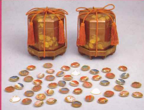
菊折枝蒔絵雛道具 貝桶・合貝 俊恭院福君(尾張家11代齊温継室)所用