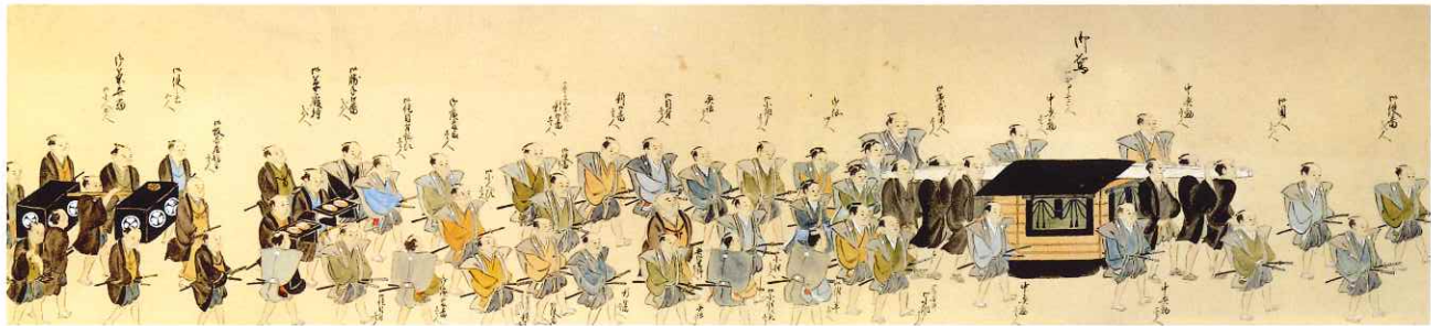
徳川直七郎(斉温・尾張家11代)宮参り行列図 二巻の内(部分)

表面の作品 ・重要文化財 刀 金象嵌銘 正宗磨上 本阿弥(花押) 名物 池田正宗 伊達政宗・池田長吉・徳川秀忠(2代將軍)ほか所持 ・花地色蔓葵紋付子持筋熨斗目 徳川綱誠(尾張家3代)・吉通(同家4代)着用