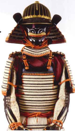
黒塗白糸威具足 徳川綱誠(尾張家3代)・義宜(同家16代)着用▶

本展覧会では、大名家において行われたさまざまな儀礼を、尾張徳川家の伝来品を中心に紹介します。※会期中展示替えがあります。