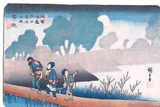
木曾海道六拾九次之内 宮ノ越