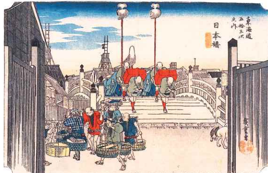
東海道五拾三次之内 日本橋 朝之景(保永堂版)