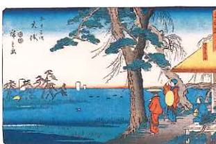
東海道 九 五十三次 大磯(隷書版)