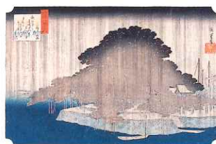
近江八景之内 唐崎夜雨