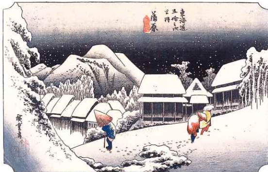
東海道五拾三次之内 蒲原 夜之雪(保永堂版)

風景画の名手歌川広重の代表作である保永堂版「東海道五拾三次之内」全55図に加え、行書版、隷書版、堅絵東海道などの各種東海道絵や、広重のもうひとつの代表的街道絵である「木曾海道六拾九次之内」から作品を紹介いたします。 また、江戸や近江などの名所絵もあわせて紹介し、広重の風景画の世界をすぐれた個人コレクションとともに堪能いただけます。