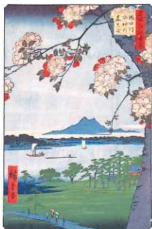
名所江戸百景 隅田川 水神の森真崎