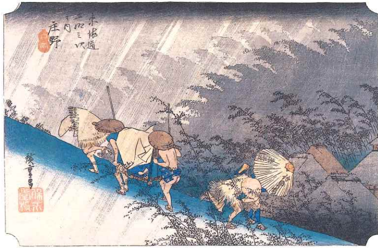
東海道五拾三次之内 庄野 白雨(保永堂版)

風景画の名手歌川広重の代表作である保永堂版「東海道五拾三次之内」全55図に加え、行書版、隷書版、堅絵東海道などの各種東海道絵や、広重のもうひとつの代表的街道絵である「木曾海道六拾九次之内」から作品を紹介いたします。 また、江戸や近江などの名所絵もあわせて紹介し、広重の風景画の世界をすぐれた個人コレクションとともに堪能いただけます。