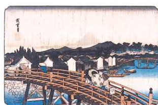
東都名所 日本橋之白雨