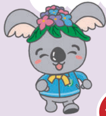
千種区マスコットキャラクター「こあらっち」

コースを歩いてクイズに答えてね。答えていただいた方には、賞品をプレゼント!(先着300人)