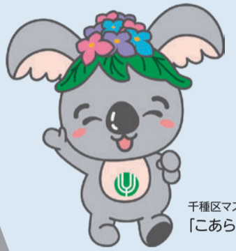
千種区マスコットキャラクター「こあらっち」

春にはらん漫の花で彩られる桜並木のすいどうみち緑道をのぼりつめると、そこは静寂に包まれた錠薬師。中国風の石仏が迎えてくれます。天満すいどうはしを渡ると天満緑道。さらに千種公園へと続く、水と緑に憩うみち。