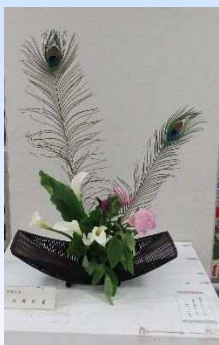
ロビーでの 生け花の展示