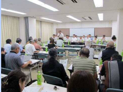
南東部ブロック会議

今後のめざすまちの姿など、区政に対する皆さまのご意見をお聴かせいただく区民会議として、「千種区区民ブロック会議」と「千種区区民の集い」を開催します。