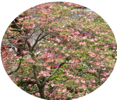
区の木：ハナミズキ