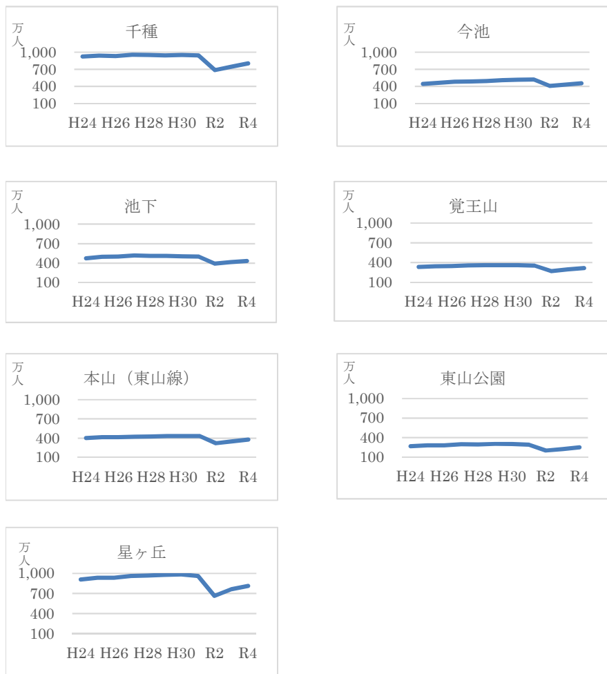
図 1：千種区内の東山線各駅の乗車人員数