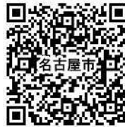
名古屋市公式ウェブサイト