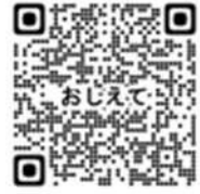
名古屋おしえてダイヤル