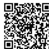
名古屋通知热线 (仅限日语)

您可以在「名古屋官方网站」以及「名古屋通知热线（电话953—7584）」上确认处理作业等情况。