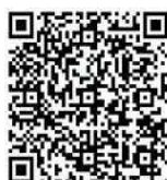
名古屋市官方网站 (配有AI翻译功能)