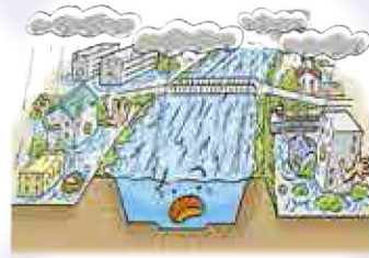
さらに雨が降り続けると、河川の水位が上昇し、堤防が決壊するおそれがあります。