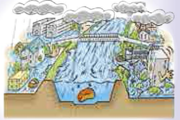
堤防が決壊すると多大な被害が発生します。