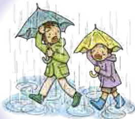
非常に激しい雨が降ると