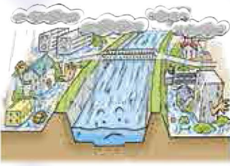
雨水が下水道などで全て排水できずたまります。