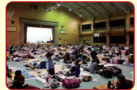
熊本地震の避難所の様子