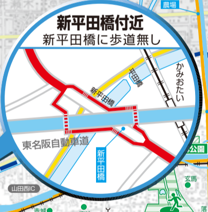
新平田橋付近 新平田橋に歩道無し