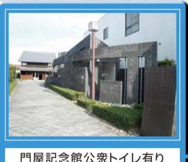
門屋記念館公衆トイレ有り