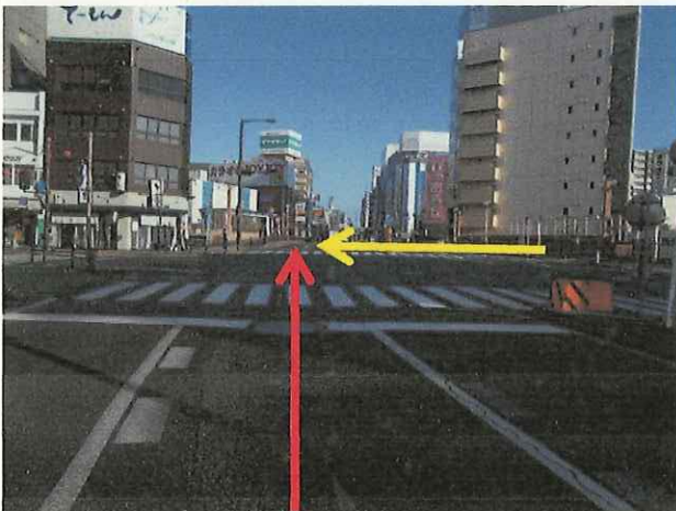
（中型貨物車進行方向）