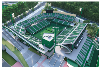
▲改築工事中の東山公園テニスセンターセンターコートのパース図 ※色彩などは検討段階のものであり変更される場合があります

🗨️ 委員会での議論の様子は、市ウェブサイト(市会情報)から録画中継を視聴できます。