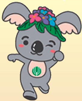
千種区マスコットキャラクター 「こあらっち」