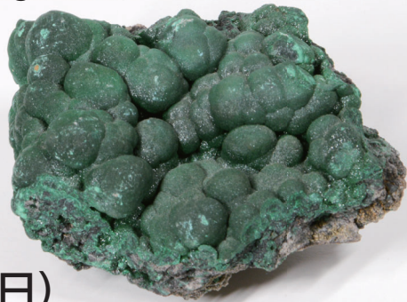
くじゃくいし 孔雀石 (マラカイト) 名古屋市科学館蔵

にほんが えいご いし まな 日本画の絵の具のもとになる石について学んで、 ざらざら、きらきら、つるつる?な じぶん えか 自分だけの絵を描いてみよう!