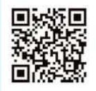
Yahoo! JAPANアプリ 紹介・DLページ

アプリを入手し「地域登録」設定することであらゆる防災情報がプッシュ通知で届きます。