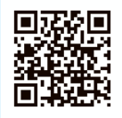
Yahoo!防災速報 紹介ページ