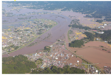
令和元年東日本台風で中小河川(内川・新川)が決壊し、浸水するようす

注意! 中小河川は水位が短時間で急激に上昇する場合がありますので、危険な時は早めの避難を!