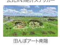
田んぼアート南陽

Instagramや地産地消マップなどで南陽の農業の魅力を発信するほか、港区の特産物や地産地消をPRするため、初夏と秋に野菜マルシェを開催します。