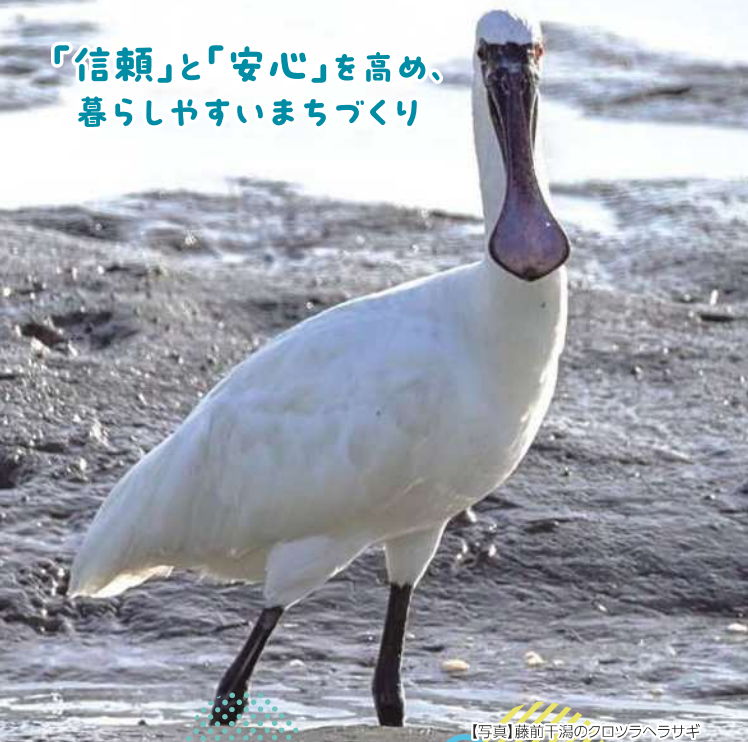
【写真】藤前干潟のクロツラヘラサギ