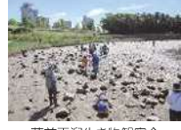
藤前干潟生き物観察会

藤前干潟の水質浄化機能や、生物多様性について学び、環境を大切にしようとする意識の向上を目指します。