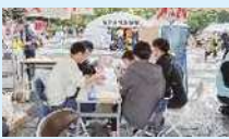
港区版「わが家のマイ・タイムライン」作成支援活動