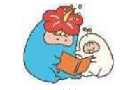
みなと子育て応援キャラクター「みなとん」