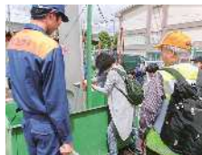
防災訓練(水圧体験)

「地区防災カルテ」を活用した話し合いを進めるほか、地域課題やニーズに応じた防災訓練などの実施を支援し、地域の防災組織の機能強化を図ります。