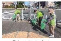
クリーンキャンペーン

「クリーンキャンペーン」における地域の清掃活動の支援や空地をきれいにする運動を通じて、地域住民の「まちを美しく」という意識の向上を推進します。