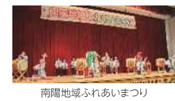
南陽地域ふれあいまつり

南陽地域の伝統芸能や地元小中学生による演奏など、地域住民のふれあいと交流を目的とした企画を実施します。マップ「南陽さんぽ」を活用したウォーキングイベントも同日開催します。