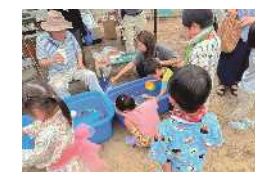
みなと外国人コミュニティパートナー任命式

外国人住民が地域コミュニティの一員になることを促進していくためのリーフレット・動画の活用や、みなと外国人コミュニティパートナーとの協力により、外国人住民と地域とのつながりづくりを支援します。