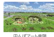
田んぼアート南陽

インスタグラムや地産地消マップなどで南陽の農業の魅力を発信するほか、港区の特産物や地産地消をPRするため、初夏と秋に野菜マルシェを開催します。