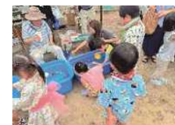
みなと外国人コミュニティパートナー任命式

外国人住民が地域コミュニティの一員になることを促進していくためのリーフレット・動画の活用や、みなと外国人コミュニティパートナーとの協力により、外国人住民と地域とのつながりづくりを支援します。