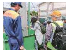
防災訓練(水圧体験)

「地区防災カルテ」を活用した話し合いを進めるほか、地域課題やニーズに応じた防災訓練などの実施を支援し、地域の防災組織の機能強化を図ります。