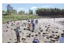
藤前干潟生き物観察会