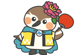
夏まつり(当知学区)

町内会・自治会の加入促進や地域コミュニティ活性化に向けた取り組み、地域コミュニティを支える未来の担い手を育成する活動を支援します。