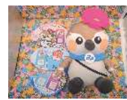
みなびのぬいぐるみと公式SNS紹介ステッカー

「来て、見て、知って!住みたいまち 住み続けたいまち港区」をコンセプトに港区の魅力を発信するとともに、区内外の方が港区の魅力を体験できる取り組みを推進します。