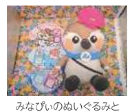
みなぎのぬいぐるみと公式SNS紹介ステッカー

「来て、見て、知って!住みたいまち 住み続けたいまち港区」をコンセプトに港区の魅力を発信するとともに、区内外の方が港区の魅力を体験できる取り組みを推進します。