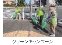
グリーンキャンペーン

「グリーンキャンペーン」における地域の清掃活動の支援や空をきれいにする運動を通じて、地域住民の「まちを美しく」という意識の向上を推進します。