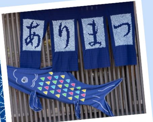
名古屋の伝統工芸に触れる