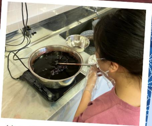
絞り染めで新しく創ろう