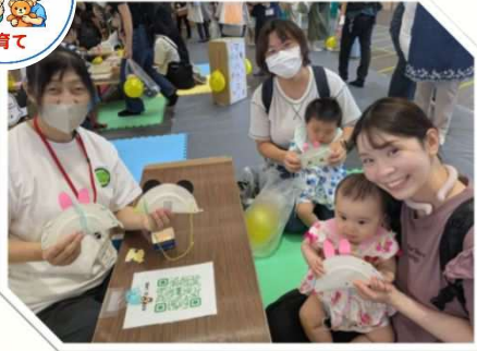
No.13 子育て家庭の交流イベント、 講座の開催