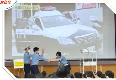
No.8 交通安全対策の推進