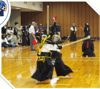
No.23 スポーツ・生涯学習を 通じた地域づくり