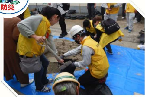
No.2 災害対応体制の強化