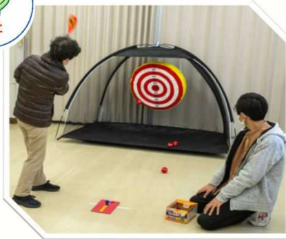
No.17 高齢者が地域でいきいきと 暮らしていくための支援