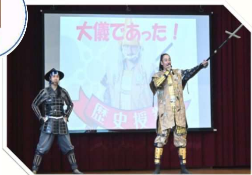
No.24 まちの魅力を伝える・広める