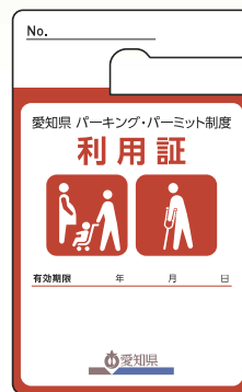
有効期限 年 月 日 有期限の利用証