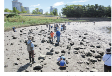
藤前干潟生き物観察会

藤前干潟の水質浄化機能や、生物多様性について学び、環境を大切にすることを意識の向上を目指します。