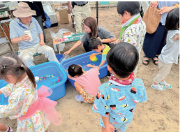
みなと外国人コミュニティパートナー任命式

外国人住民が地域コミュニティの一員になることを促進していくためのリーフレット・動画の活用や、みなと外国人コミュニティパートナーとの協力により、外国人住民と地域とのつながりづくりを支援します。