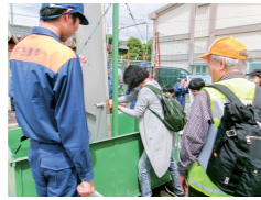
防災訓練(水圧体験)

「地区防災カルテ」を活用した話し合いを進めるほか、地域課題やニーズに応じた防災訓練などの実施を支援し、地域の防災組織の機能強化を図ります。