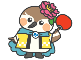
夏まつり(当知学区)

町内会・自治会の加入促進や地域コミュニティ活性化に向けた取り組み、地域コミュニティを支える未来の担い手を育成する活動を支援します。