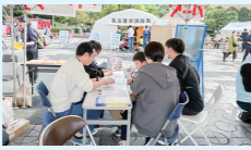
港区版「わが家のマイ・タイムライン」作成支援活動