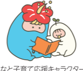
みなと子育て応援キャラクター「みなとん」