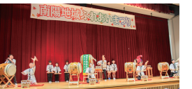
南陽地域ふれあいまつり

南陽地域の伝統芸能や地元小中学生による演奏など、地域住民のふれあいと交流を目的とした企画を実施します。マップ「南陽さんぽ」を活用したウォーキングイベントも同日開催します。