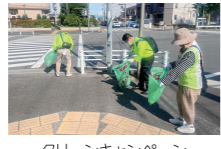
グリーンキャンペーン

「グリーンキャンペーン」における地域の清掃活動の支援や空地をきれいにする運動を通じて、地域住民の「まちを美しく」という意識の向上を推進します。