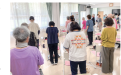
高齢者の健康づくり(いきいき教室)