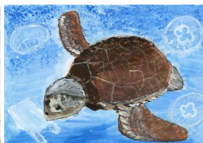
令和7年度 市長賞受賞作品