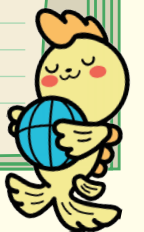
シャチのジュンちゃん