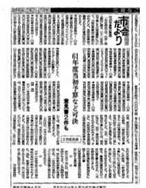
▲広報なごや昭和61年5月号の中の市会に関する記事

創刊前は…「広報なごや」の中の1コーナーとして、限られたスペースに議決結果などを掲載していました。