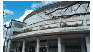
▲千種スポーツセンター

また、「令和8年度名古屋市一般会計予算」については、賛成多数により附帯決議を付することに決しました。