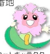
マスコットキャラクター 風花ちゃん