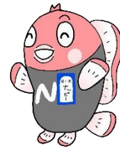
中川区マスコットキャラクター ナッピー