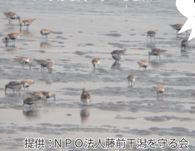
ハマシギが群れている様子

南陽地域の南東部にある藤前干潟は、魚やカニなど生き物がたくさん暮らすところで、平成14年(2002年)に、ラムサール条約に登録された国際的にも重要な湿地です。潮が最も引いた状態では驚きの東京ドーム50個分の広さになります。干潟は、いつでも見に行けば見られるというわけではありません。干潟が海面に現れるには条件があります。藤前干潟の場合、潮位が名古屋港基準面で70cm以下のときに干潟は現れます。