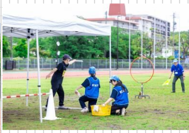
写真：前回大会の様子