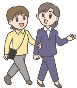
その ばしょ 場所まで あんない 案内してください