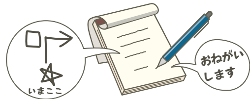
おねがい します も じ 文字や え 絵で みじか 短く わかりやすく つた 伝えてください