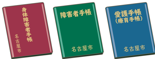
わたしは しょうがいしゃてちょう 障害者手帳を も 持っています