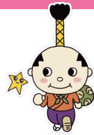
なごやし 名古屋市