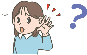
わたしは みみ 耳が き 聞こえませんが き 聞こえにくいです