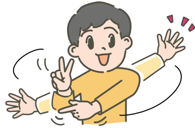
み つた 身ぶりで伝えてください