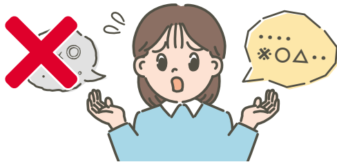
わたしは はな 話すことが むずか 難しいです