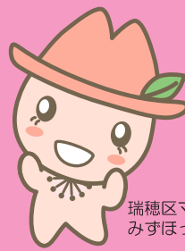
瑞穂区マスコットキャラクター みずほっぺ