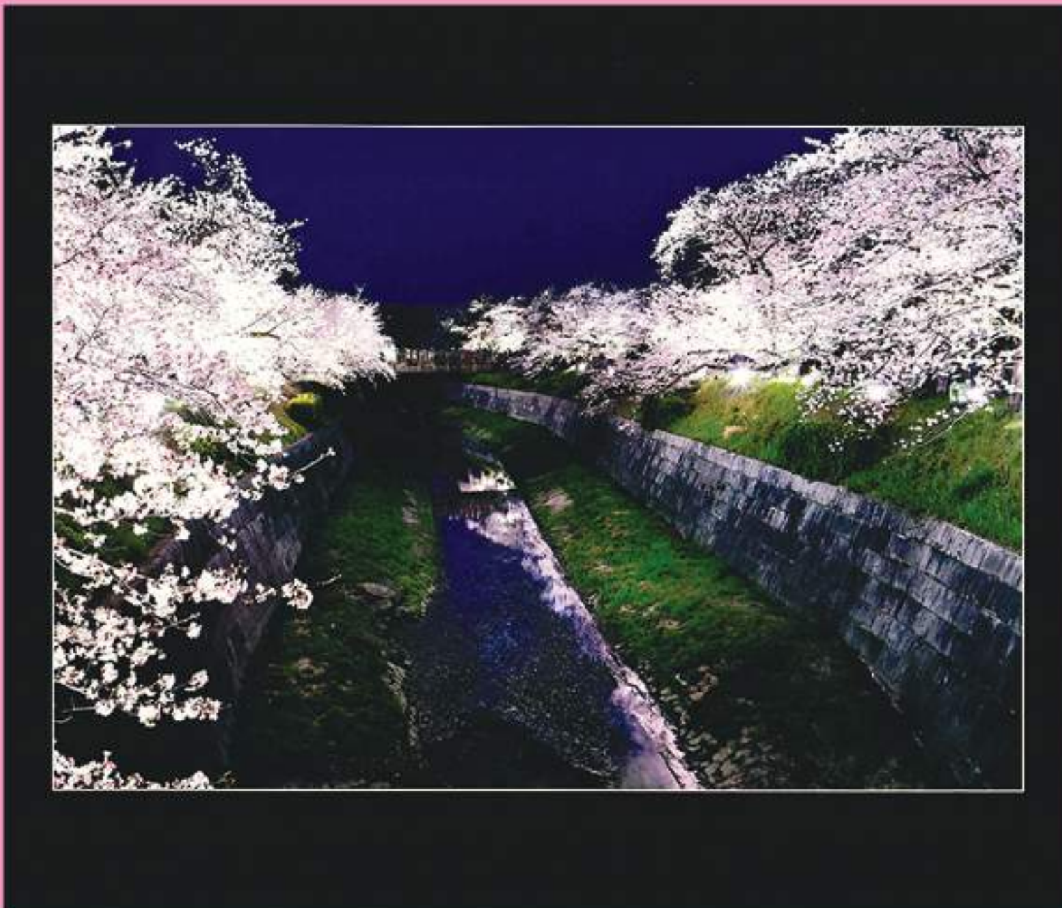
第22回 瑞穂のさくら写真展 さくら大賞/「故郷の桜」