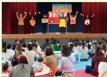
ニコニコ子育て広場