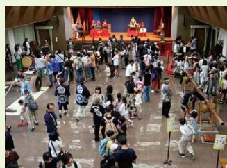
子ども山車まつり教室

東区には、市指定無形民俗文化財に指定されている5輦の山車があり、地域の無病息災を願って開催される天王祭のほか名古屋まつりや区民まつりの場面で披露されています。山車文化の魅力を特に若い世代に向けて発信し、東区の山車文化への関心を高め、次世代への継承を支援すべく、「子ども山車まつり教室」など各種事業を行います。