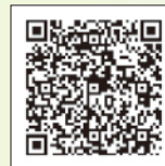
東区区政運営方針

令和8年度東区区政運営方針の全編および第2期東区将来ビジョンは、右記の二次元バーコードからご確認ください。