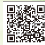
東区将来ビジョン