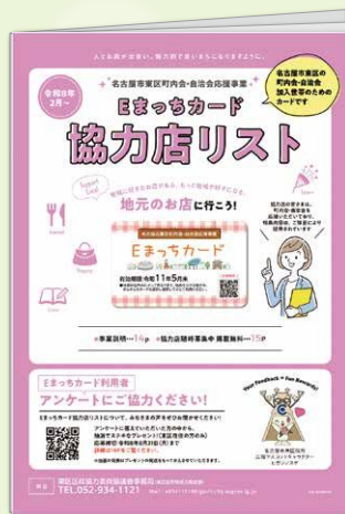
協力店リスト(左開き)