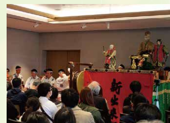
東区の山車囃子・からくり競演