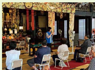
「建中寺」御霊屋ガイドツアー

「文化のみち」をPRするため、令和7年度に国の重要文化財に指定された「建中寺」の通常非公開施設の特別公開イベントを実施するとともに、Instagramをはじめとする様々な広報ツールを活用した各施設の魅力の発信、大学との連携によるInstagramキャンペーンなどで、幅広い世代に東区の歴史・文化の魅力を発信し、関心を持つ方の裾野を広げます。