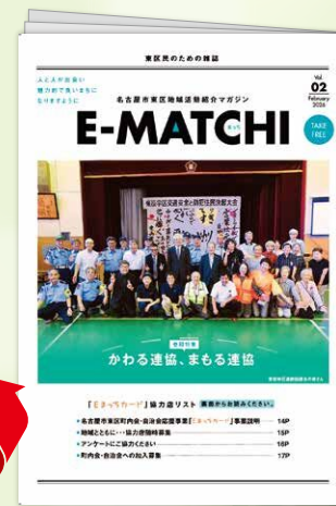
地域活動紹介マガジン(右開き)