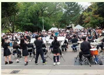
なごやかまつり・ひがし