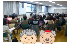
たかばあ おかじい

集会室・和室では講座の受講や同好会活動ができます。また、囲碁・将棋・卓球を自由に楽しむことができます。月～土曜日(祝日をのぞく)の午前8時45分～午後5時に開館しています。お友達づくりに是非ご利用ください。