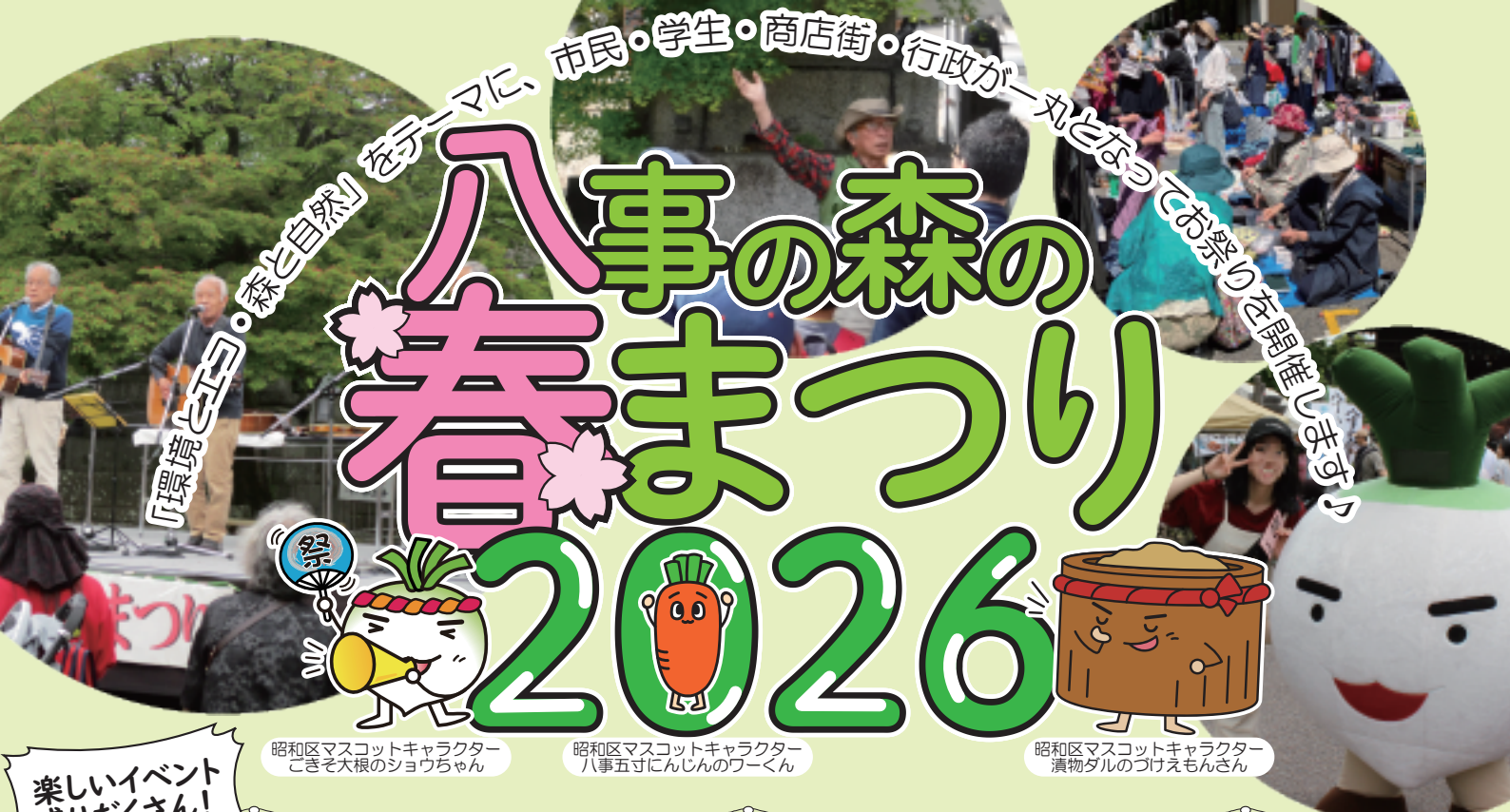
昭和区マスコットキャラクター ごきぞ大根のショウちゃん