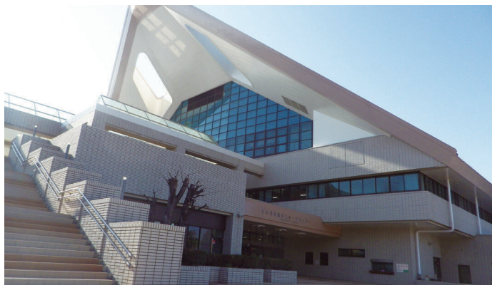
稲永スポーツセンター 名古屋市港区野跡5丁目1-10