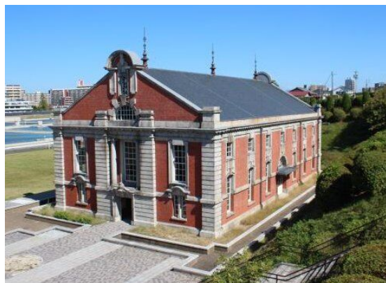
旧第一ポンプ所(大正3年)