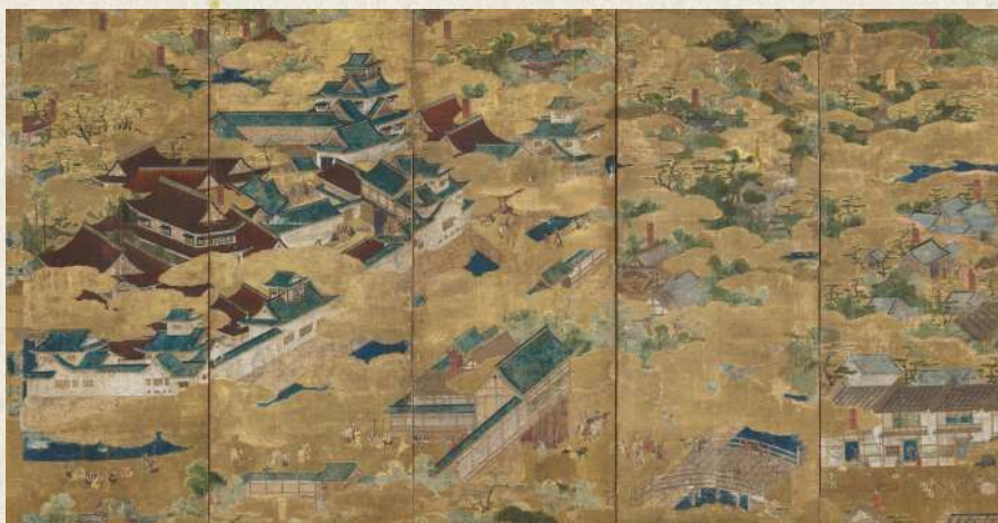
聚楽第図屏風(部分) 桃山時代 16世紀 東京・三井記念美術館蔵【後期】

2026年の大河ドラマ「豊臣兄弟!」は、「彼が長生きしていれば豊臣家の天下は安泰だった」とまで言わしめた豊臣秀長の目線で、戦国時代をダイナミックに描く物語です。本展覧会ではドラマと連動し、豊臣秀長と兄・秀吉、彼らを取りまく織田信長、徳川家康、黒田官兵衛、藤堂高虎、千利休、高台院らゆかりの品々をはじめ貴重な歴史資料を紹介。兄弟の生き様、二人が駆け抜けた時代を浮き彫りにします。